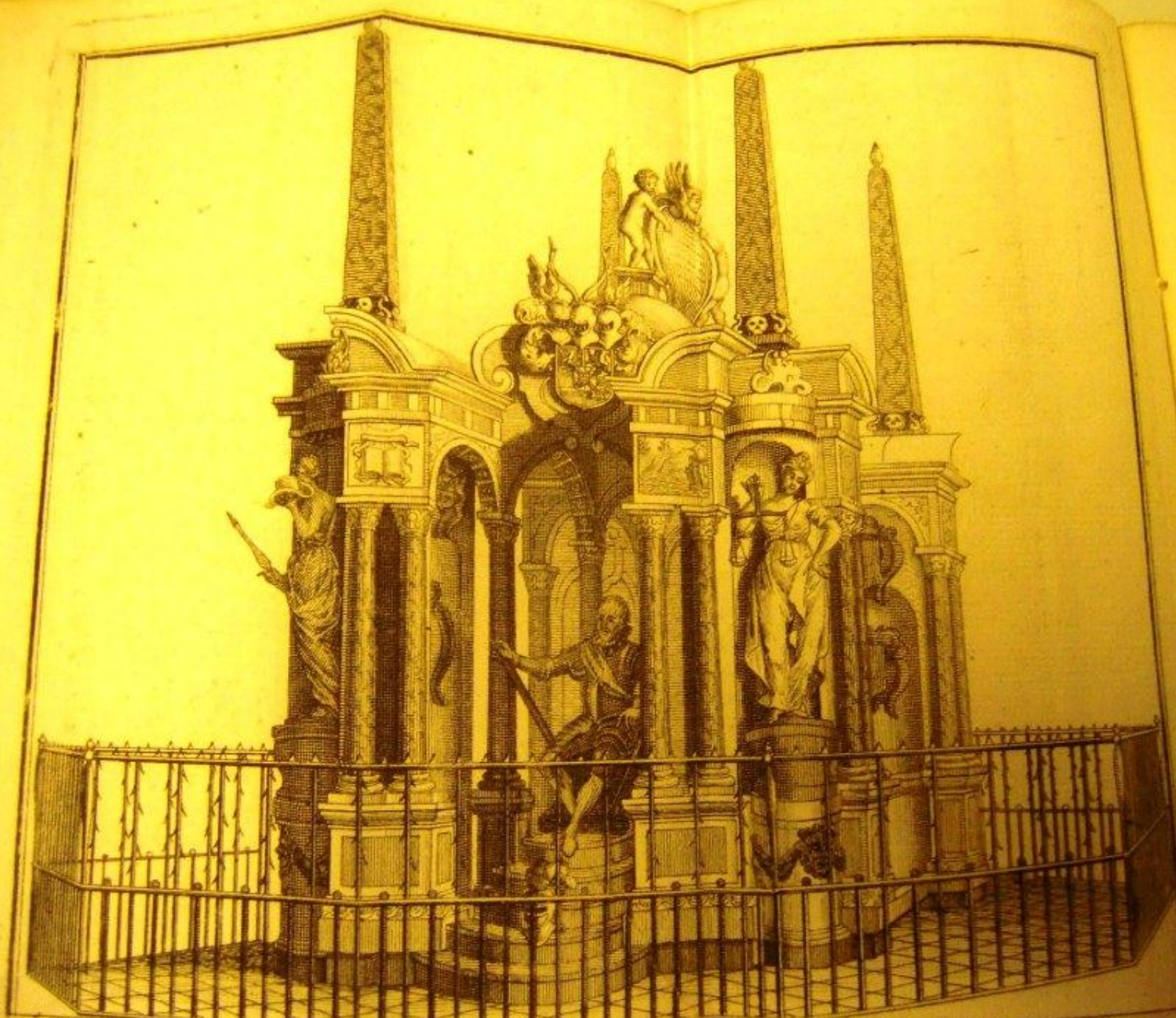
TOMBE ofte BEGRAEF PLAATS der PRINCEN van ORANGE